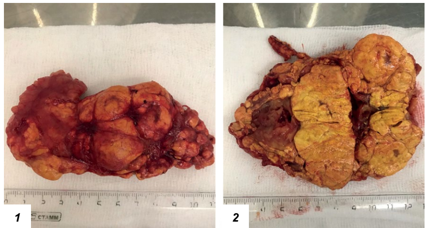
Рисунок 3. Макропрепарат надпочечника с макронодулярной гиперплазией: 1) вид измененного надпочечника со стороны капсулы, 2) вид на разрезе.

Первичная двусторонняя макронодулярная гиперплазия надпочечника (ПБМНГ) является редкой патологией, приводящей к развитию синдрома Кушинга. Для выделения данного заболевания в отдельную группу применялись различные названия: массивное макронодулярное заболевание коры надпочечников, автономная макронодулярная гиперплазия надпочечников, АКТГ-независимое массивное двустороннее заболевание надпочечников, гигантская, или огромная, макронодулярная гиперплазия надпочечников и макронодулярная дисплазия надпочечников (8).