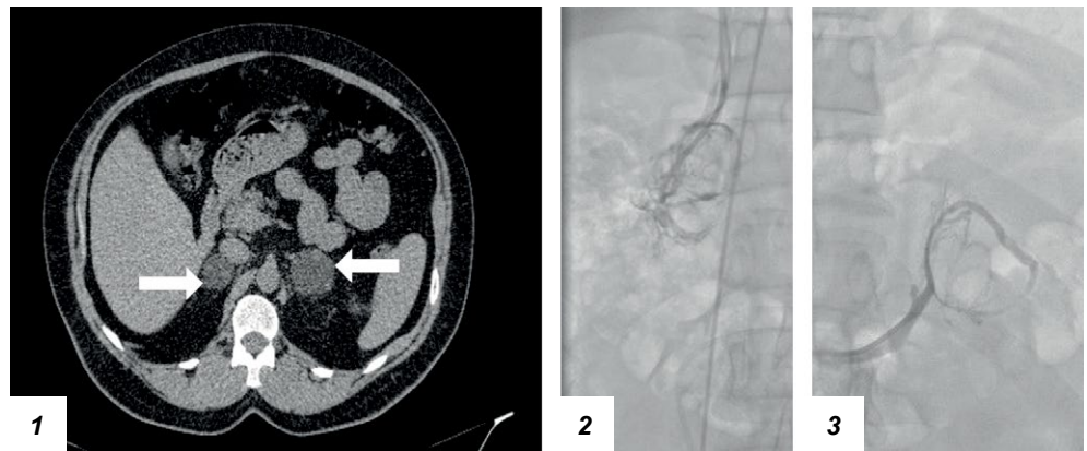
Рисунок 2. КТ органов брюшной полости и забрюшинного пространства (аксиальный срез, нативная фаза) и ангиография правого и левого надпочечников у пациентки с БМНГ с синдромом Кушинга.

Медиана градиента отношения уровня кортизола доминирующей стороны железы к показателю кортизола контрлатерального надпочечника у больных первой группы составила 1,2 [1,1; 1,3] и второй группы – 6,0 [3,9; 7,6] ( p = 0,004 ). Расчетный градиент отношения по кортизолу (доминирующий надпочечник / нижняя полая вена и контрлатеральный надпочечник / нижняя полая вена) среди больных второй группы составил \geq 7,8 и \leq 3,2 соответственно. Вместе с этим у пациентов первой группы медиана индекса (кортизол из надпочечниковой вены / кортизол из нижней полой вены) на доминирующей (д) стороне составила 5,6 [4,3; 11,6] и контрлатеральной (к) стороне – 5,0 [3,8; 8,4]. У больных первой группы и второй группы индекс латерализации находился в диапазоне 1,0 \leq \text{Li} \leq 1,5 и 3,0 \leq \text{Li} \leq 10 соответственно. Использование биомаркеров (ВЭЖХ) позволило получить дополнительные показатели латерализации у больных первой и второй