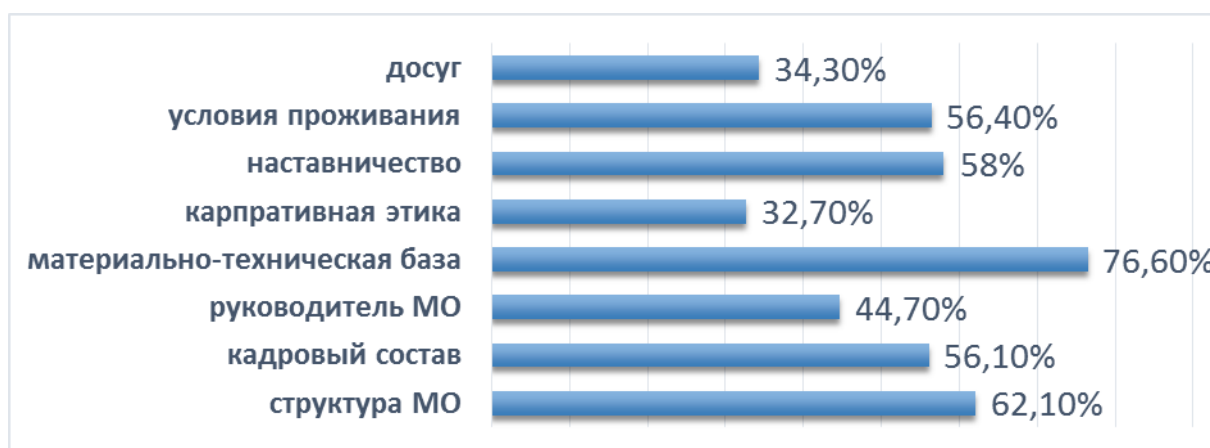
Рис. 4. Информационные разделы о работе медицинских организаций, интересующие выпускников

Отвечая на соответствующий вопрос, 40 % выпускников отметили, что могли бы изменить свое мнение и выбрали бы медицинскую организацию, расположенную в одном из районов области, как будущее место работы, после просмотра о ней видеоролика.