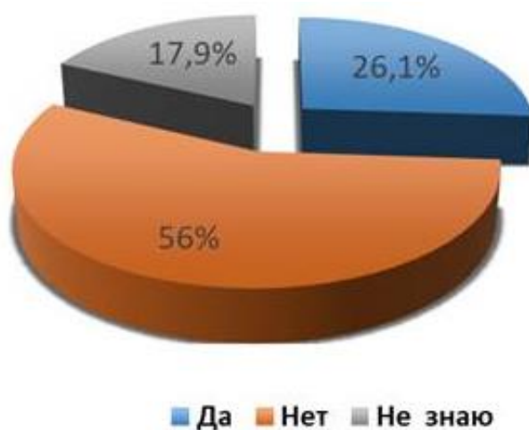
Рис. 2. Отношение выпускников к возможности трудоустройства в районные медицинские организации